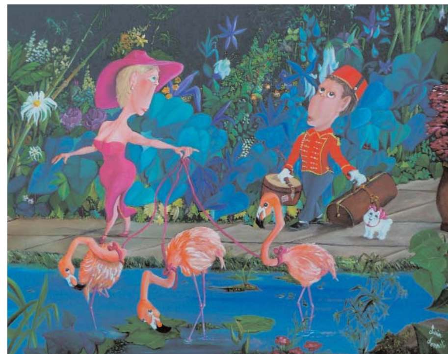
Pink Lady M, H/T, 92 x 73

L'imaginaire n'a de sens que s'il est exprimé. L'art naïf en est une des manières qui peut restituer le merveilleux avec des formes et des couleurs simples ou complexes, toutes issues de l'âme de l'artiste. L'imaginaire est aussi un refuge pour le peintre naïf qui n'est