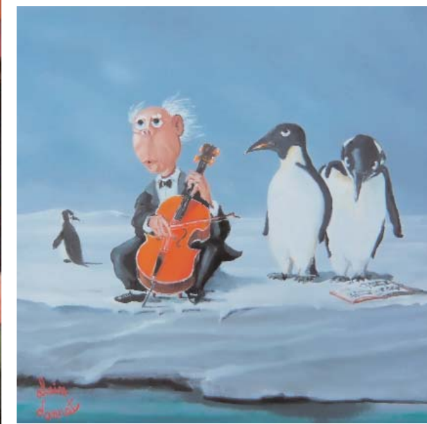
Concerto sur la banquise, H/T, 30 x 30