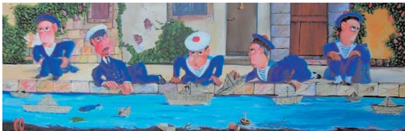
Bataille navale, H/T, 120 x 40