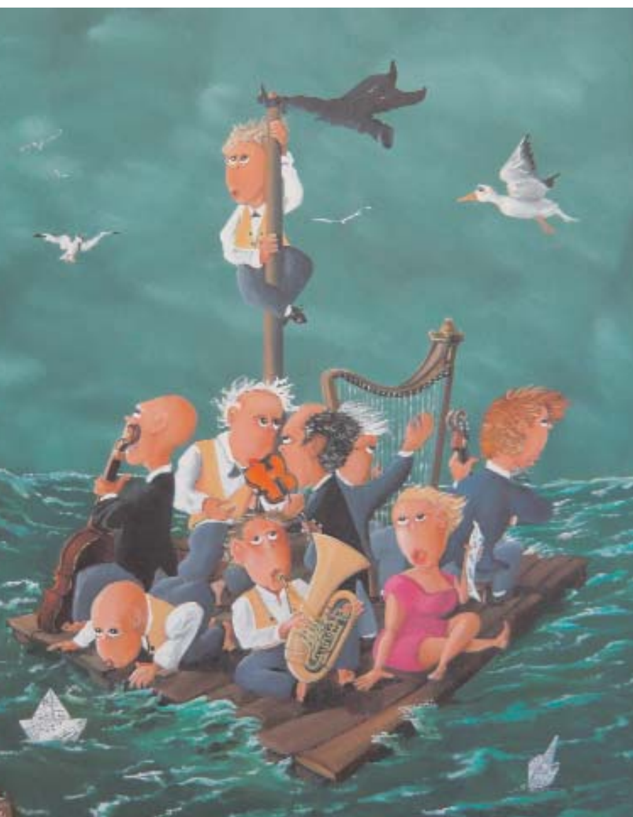
Le radeau de la musique, 73 x 60